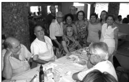
A ASPAS comemorou o Dia do Aposentado com um almoço entre os associados, no qual cada um arcou com a própria despesa

Reunião mensal com associados dia 6 de maio